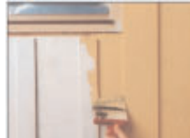
Ferdigmalt med akryl

5 Ferdigmalt to ganger med akryl. Påfør jevnt, og vær ekstra nøye med alt endetre, vindskier og andre utsatte detaljer.