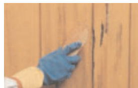
Vask og børst fasaden

2 Vask og børst fasaden med malingsvask. Bruk beskyttelseshansker. Ta bort eventuelt jordslag med jordslagsvask for utendørsbruk. Skyll grundig med vann. Bruk hageslangen.