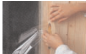
Dekk over vinduer

1 Dekk over blomster, vekster og vinduer med dekkplast.