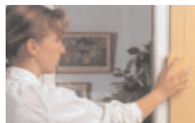
Fjern all løs maling

3 Skrap og slip bort all maling som sitter løst. Gjør alle harde og blanke flater rye med slipepapir. Børst bort alt støv og alle løse stoffer.